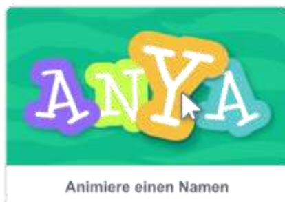
Animiere einen Namen