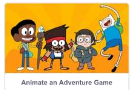
Animate an Adventure Game