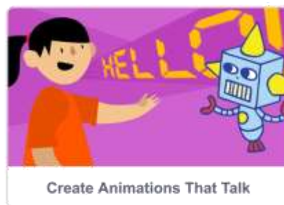
Create Animations That Talk